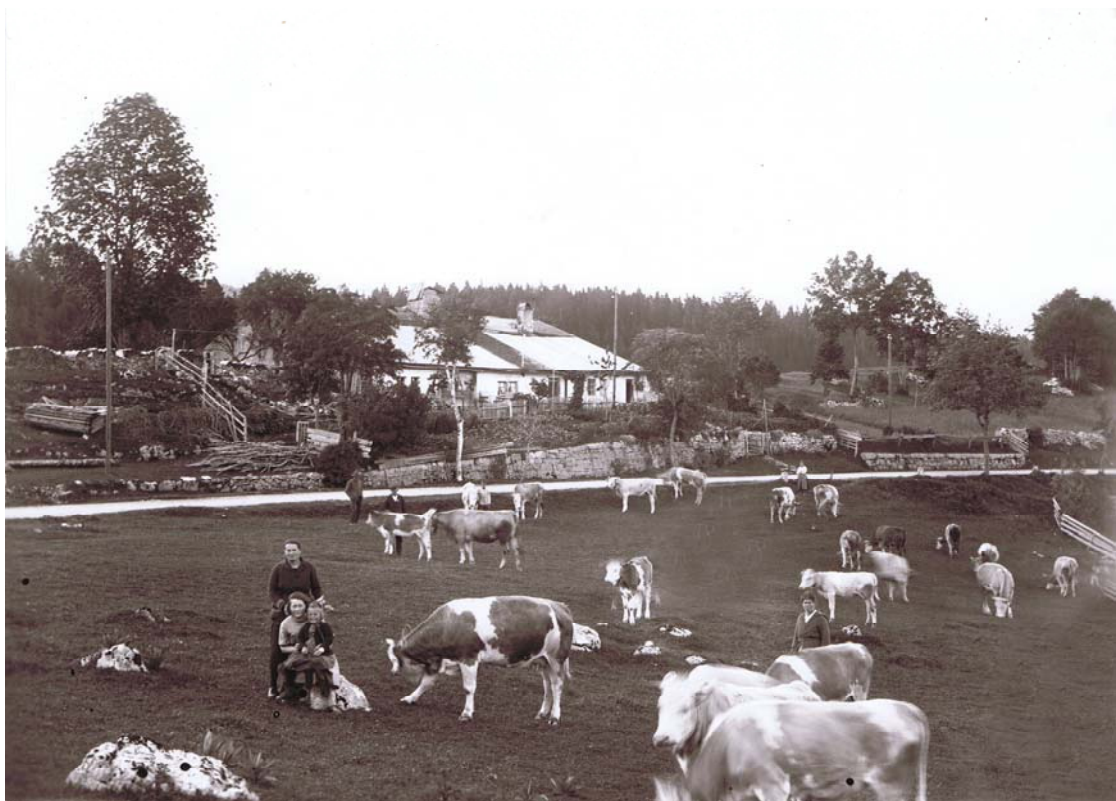
Ici vers 1930-1940. L'entonnoir se trouverait à droite, juste en dessous de la route cantonale.