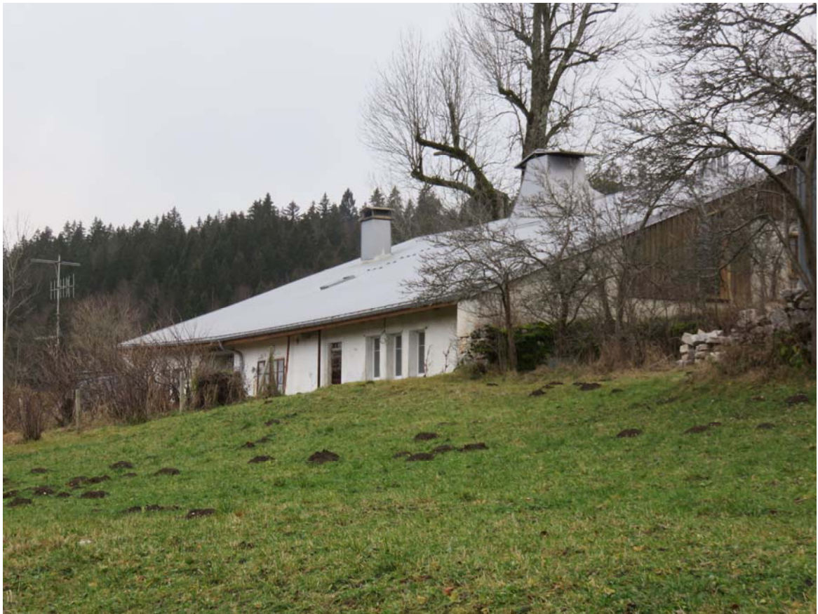
La Grand'Sagne, vaste et belle ferme construite en 1676.